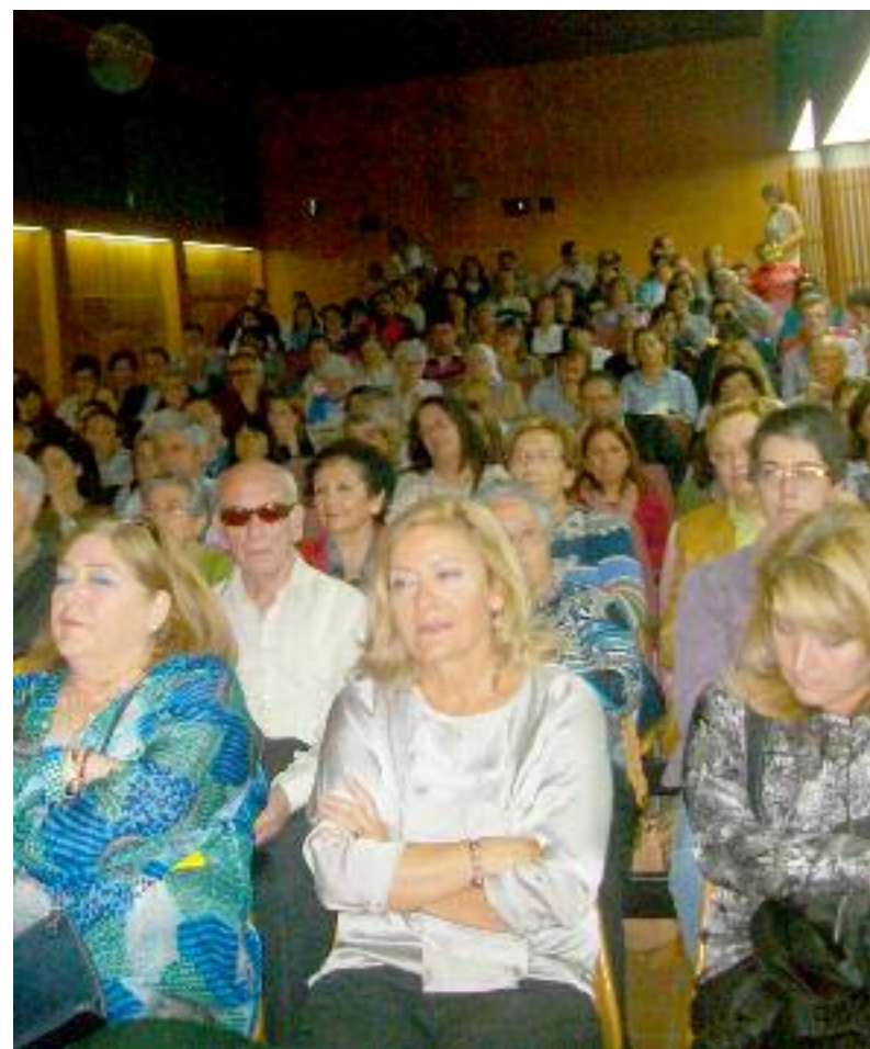
La conferencia fue seguida por una gran cantidad de turolenses