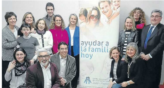
Equipo de voluntarios del Centro de Orientación Familiar.

El COF se creó a finales de diciembre de 2010 por iniciativa del Arzobispado de Zaragoza. Empezó siendo un punto de orientación familiar (consultas) y a lo largo de estos años de consolidación ha ampliado considerablemente su labor preventiva con talleres grupales y otras actividades. Cuenta con el apoyo de Acción Social Católica y Fundación Caja Inmaculada.